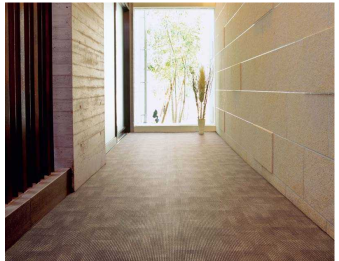
～ カーペット柄でグレード感の高い防滑性フロア「ノンスキッド」～ PX-1243 の施工例 PX-1243 : 3,550 円/平米 (税別・施工費別)